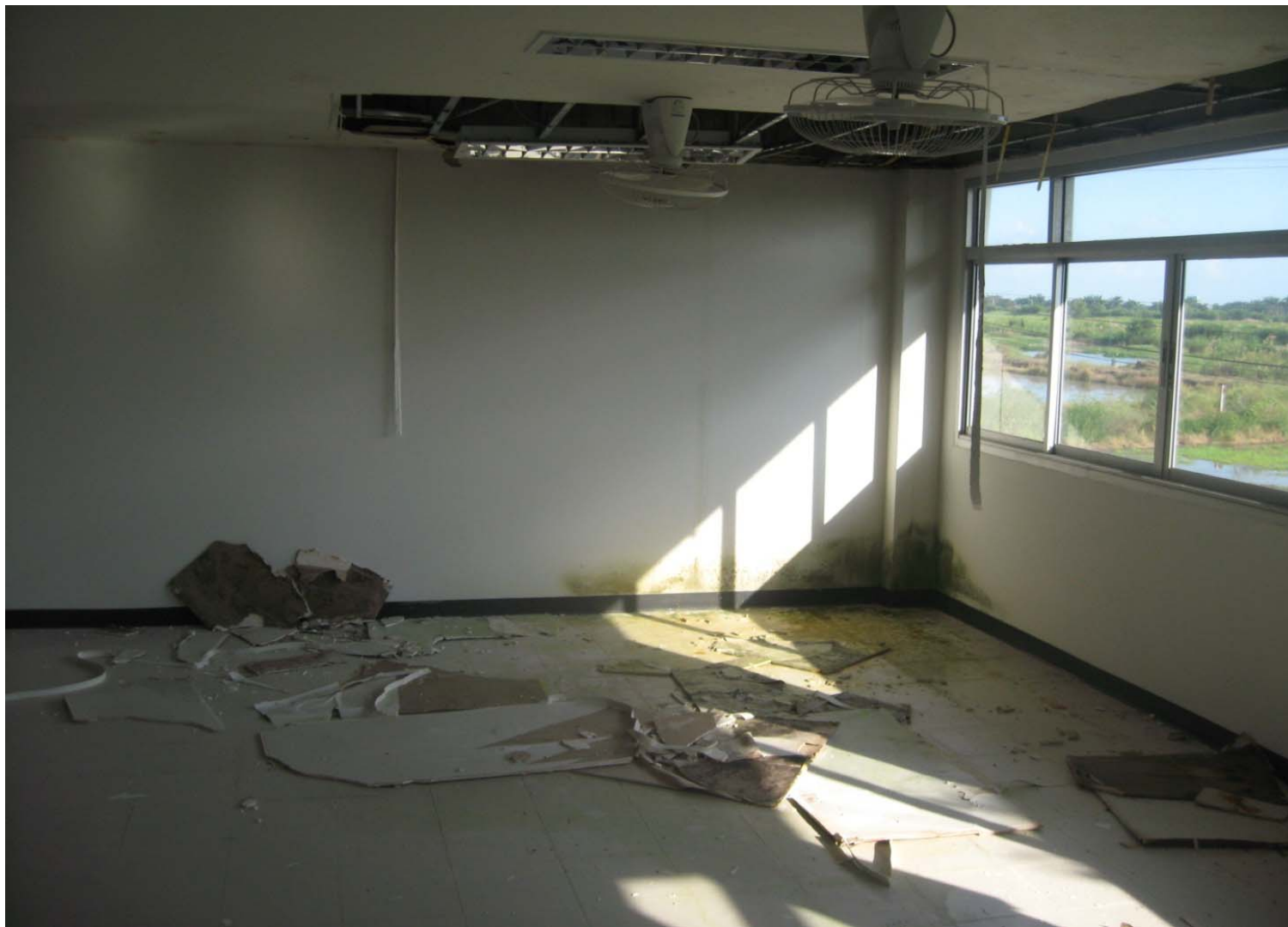
โครงการก่อสร้างอาคารสำนักงาน