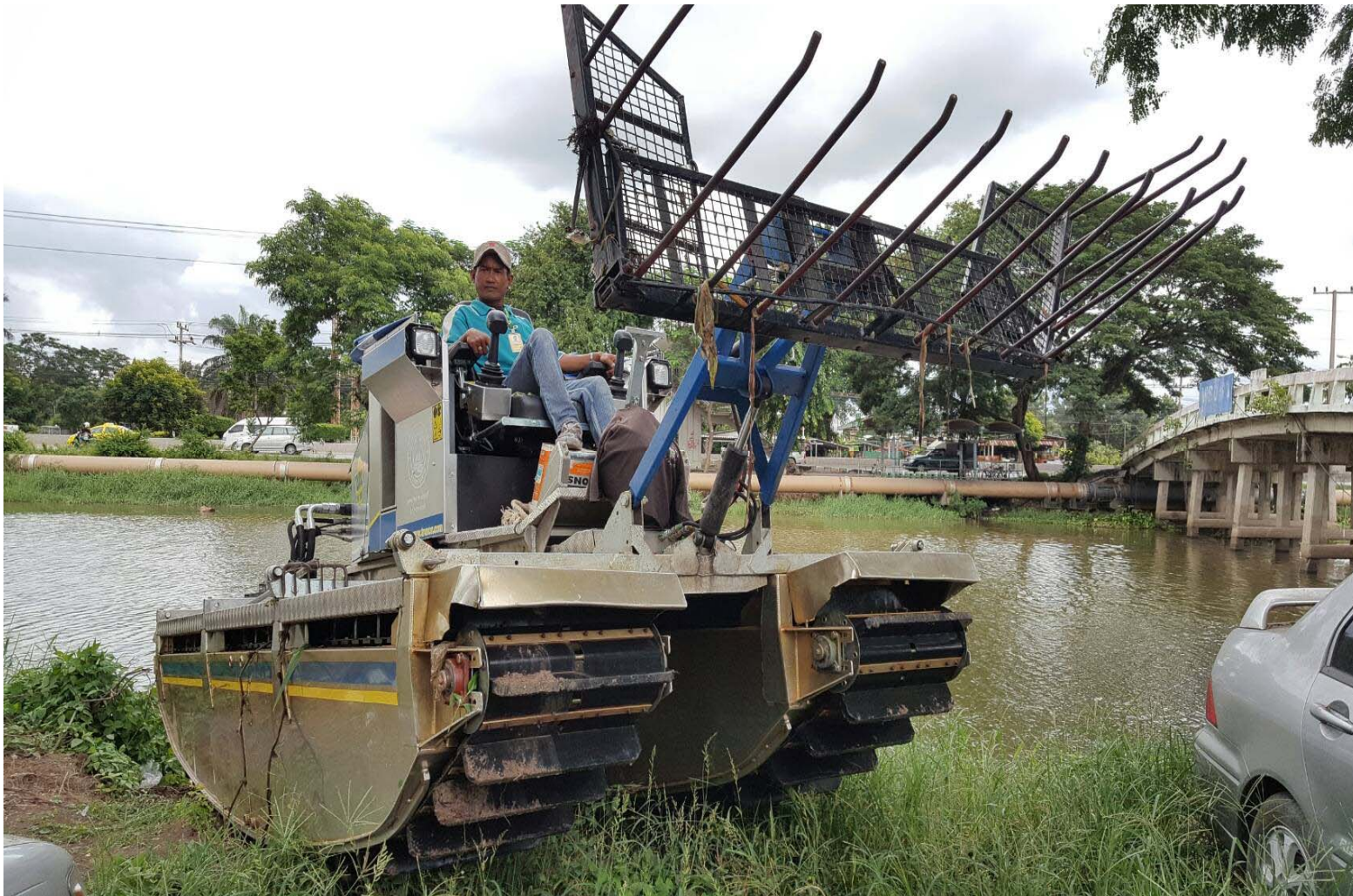
เรือกำจัดผักตบชวา