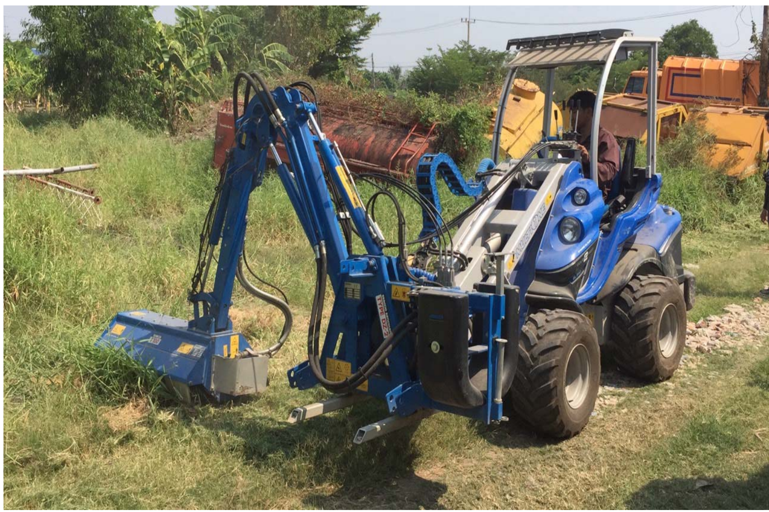
รถตัดหญ้า