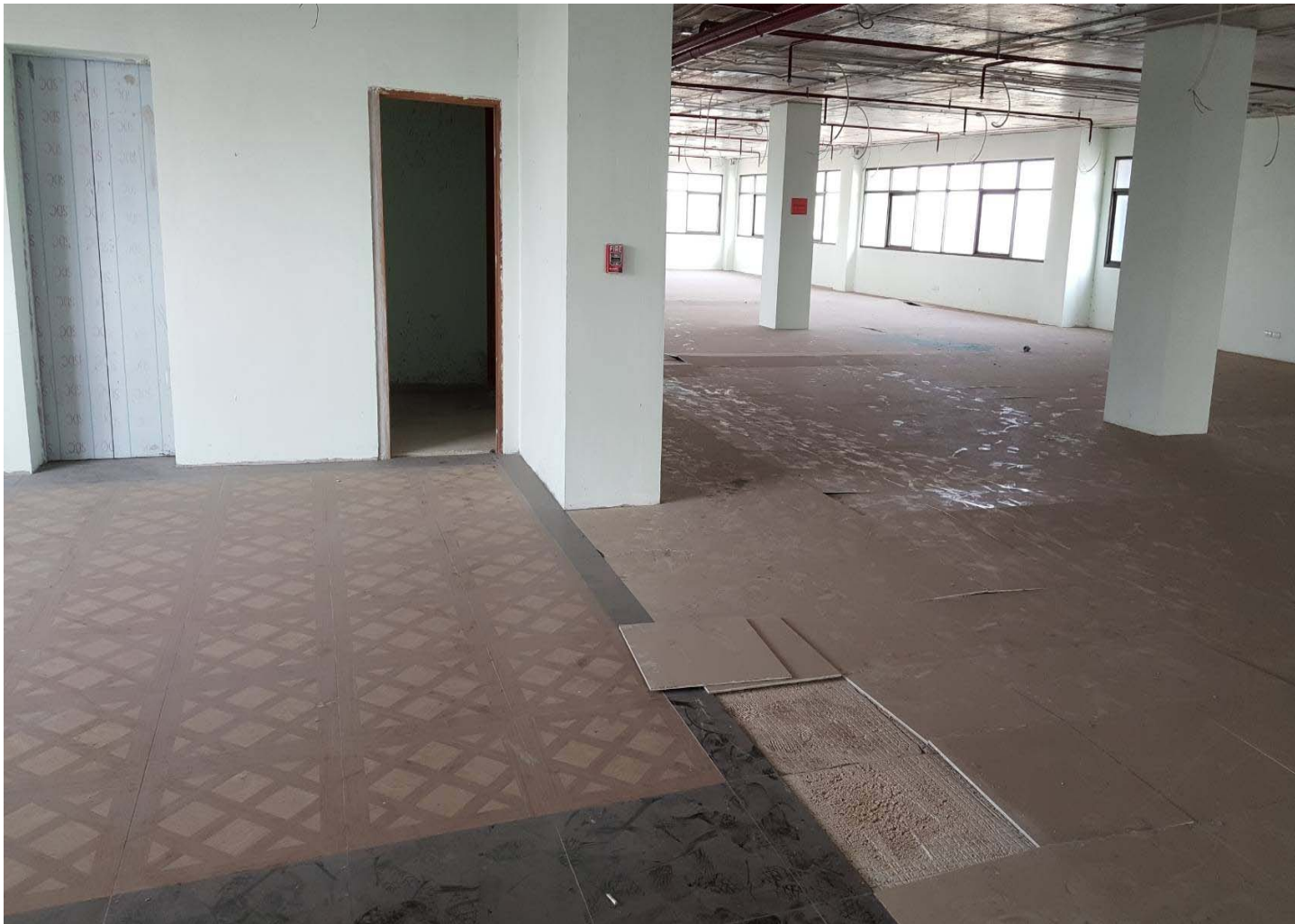
โครงการก่อสร้างอาคารสำนักงาน