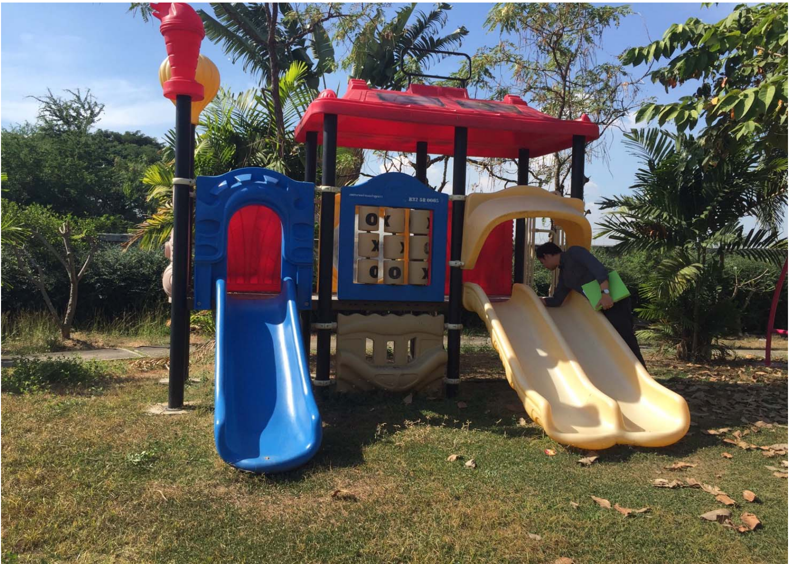
เครื่องเล่นเด็กกลางแจ้ง