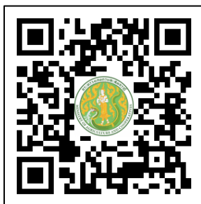
แบบรายงานผล และแบบฟอร์ม ๑-๗

สำนัก/กอง ดำเนินการประเมินองค์กรคุณธรรมตามเกณฑ์การประเมินและเกณฑ์การให้คะแนนที่กำหนด โดยระบุเอกสารหลักฐานที่ใช้ในแต่ละข้อให้ครบถ้วน พร้อมแนบไฟล์เอกสารหลักฐานที่ใช้ประกอบการประเมินในแต่ละข้อ ทั้งนี้ สามารถดาวน์โหลดเอกสารแบบรายงาน และแบบฟอร์มการจัดทำข้อมูลในแต่ละข้อ (แบบฟอร์มที่ ๑ - ๗) ตาม QR Code