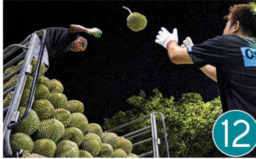
เงินเฟ้ออ่วม โลกเผชิญวิกฤตเศรษฐกิจ ส่งโอกาสที่ไทยคว้าได้