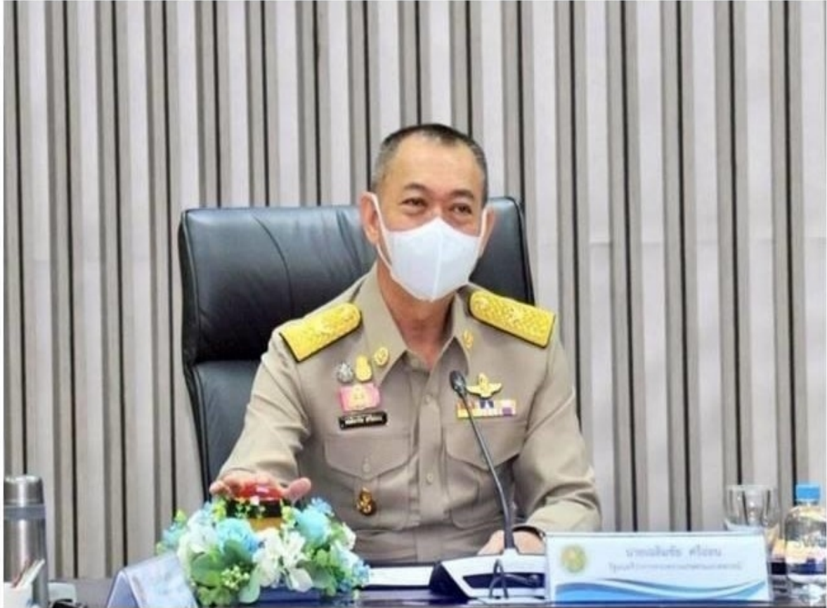
นายเฉลิมชัย ศรีอ่อน รัฐมนตรีว่าการกระทรวงเกษตรและสหกรณ์

ทั้งนี้ นายอลงกรณ์ กล่าวว่า ภาพรวมของไม้ผลทั้ง 4 ชนิดได้เริ่มออกสู่ตลาดตั้งแต่เดือนเมษายนที่ผ่านมา และจะออกต่อเนื่องจนถึงเดือนธันวาคม 2565 โดยผลผลิตจะออกมากที่สุดช่วงเดือนกรกฎาคมถึงเดือนกันยายน 2565 ซึ่งขณะนี้ ทูเรียน มังคุด เงาะ ส่วนใหญ่อยู่ระยะการเจริญเติบโตอยู่ในช่วงผลเล็ก โดยทูเรียน ออกดอกแล้ว ร้อยละ 64