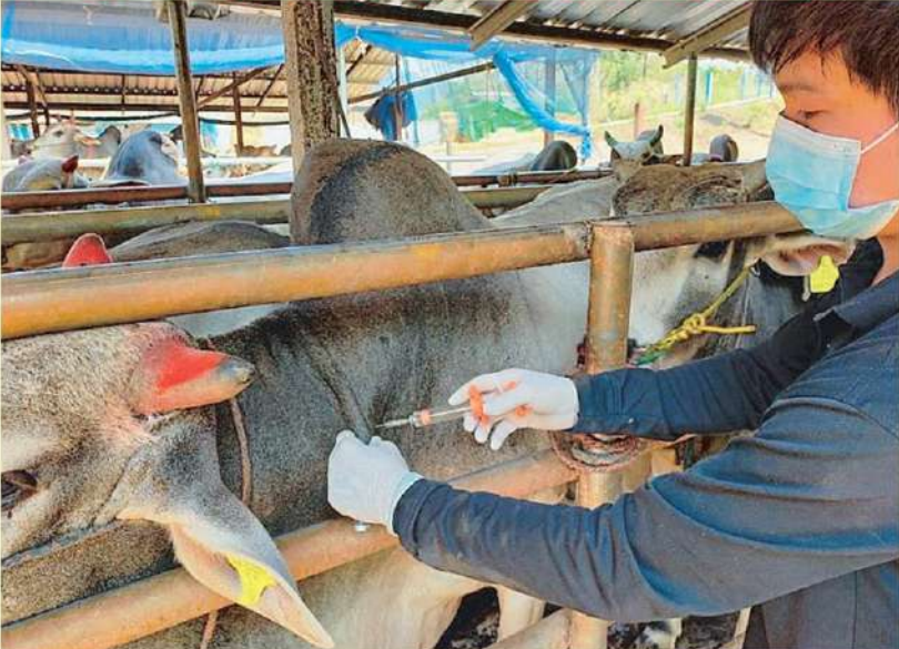
อาการ ให้แยกสัตว์ป่วยออกจากฝูงเพื่อลดการแพร่โรคในฝูง”

โรคลมปี สกีนมาก่อน “การรักษาสัตว์ป่วยด้วย โรคลมปี สกีนเป็นการรักษาโรคตามอาการ ไม่มีวิธีรักษาเฉพาะ ซึ่งอาจต้องคัดสัตว์ที่ป่วยทิ้ง เนื่องจากให้ผลผลิตไม่ดี