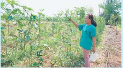
เกษตรกรด้านการพัฒนาที่ดินพร้อมสนับสนุนวัสดุ

อุปกรณ์ในการทำปุ๋ยหมักและน้ำหมักชีวภาพกรมประมงส่งเสริมการเลี้ยงปลาเพื่อเพิ่มผลผลิตสัตว์น้ำในช่วงฤดูปลาวางไข่พร้อมสนับสนุนพันธุ์ปลา