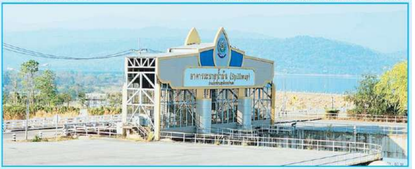
และอาหาร

ส่งผลให้เกษตรกรร้อยละ 44 มีรายได้เพิ่มขึ้นเฉลี่ย 12,414 บาทต่อครัวเรือนต่อปี จากการจำหน่ายพืชผักสวนครัว ปลา ไก่เนื้อ ไข่ และการแปรรูปผลผลิต เกษตรกรร้อยละ 67 สามารถลดรายจ่ายได้เฉลี่ย 9,213 บาทต่อครัวเรือนต่อปี จากการนำพืชผักสวนครัว ปลา ไก่ ไข่ มาบริโภคในครัวเรือน และเกษตรกรร้อยละ 44 สามารถลดค่าใช้จ่ายในการผลิตลงได้เฉลี่ย 3,259