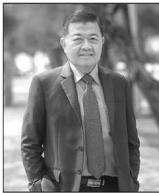
ดร.วิณะโรจน์ ทรัพย์ส่งสุข

ตลอดระยะเวลา 49 ปี แห่งการยืนหยัดเคียงข้างเกษตรกรไทย นับเป็น 49 ปี แห่งการวางรากฐานเพื่อยกระดับคุณภาพชีวิตของพี่น้องเกษตรกรในเขตปฏิรูปที่ดิน และเป็น 49 ปี แห่งการยึดมั่นและเดินตามพระราชดำริส ี่คือ 49 ปี แห่งการสถาปนา สำนักงานการปฏิรูปที่ดินเพื่อเกษตรกรรม ยกระดับเอกสารสิทธิ ส.ป.ก.