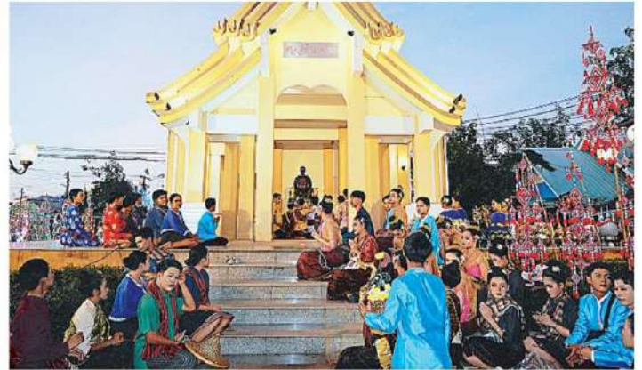
หุ่นท่องเที่ยว ภาพลิเก้จัดงาน "กะลีนสู่งเฮียง เมืองอุคมสุข" ส่งเสริมอนุรักษ์ภูมิปัญญาท้องถิ่น ประจำปี 2567 ที่ตลาดน้ำอิมปาว จ.กาฬสินธุ์ กิจกรรมกระตุ้นเศรษฐกิจ วิถีชุมชน สินค้าท้องถิ่น.