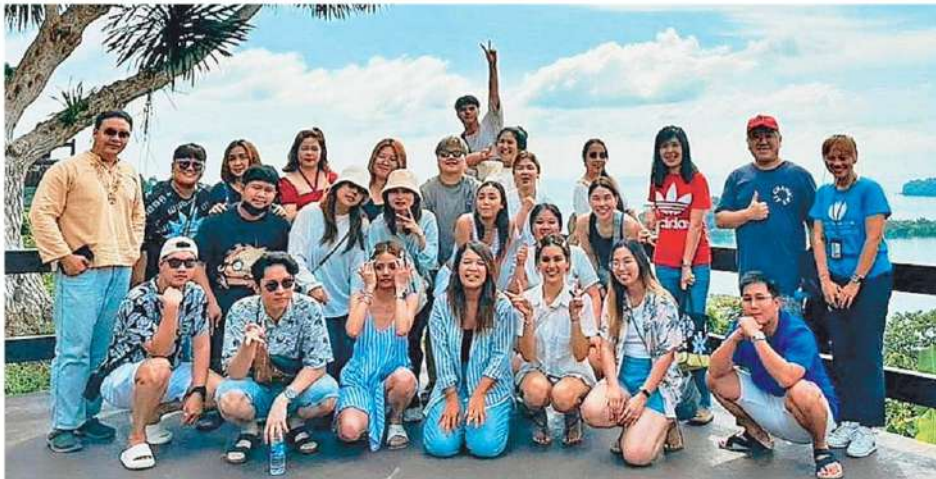
วิวดี จุดชมวิวก่อนเข้ เขตอุทยานแห่งชาติหมู่เกาะช้าง จ.ตราด แลนด์มาร์กสำคัญที่มีวิวทะเลอันสวยงาม เห็นเกาะเล็กๆเรียงราย 4 เกาะ นักท่องเที่ยวไม่พลาดพากันไปแวะเช็คอินถ่ายภาพเป็นที่ระลึก.

หัวข้อข่าว: ท่องเที่ยวทั่วไทยกระตุ้นเศรษฐกิจฟูเฟื่อง