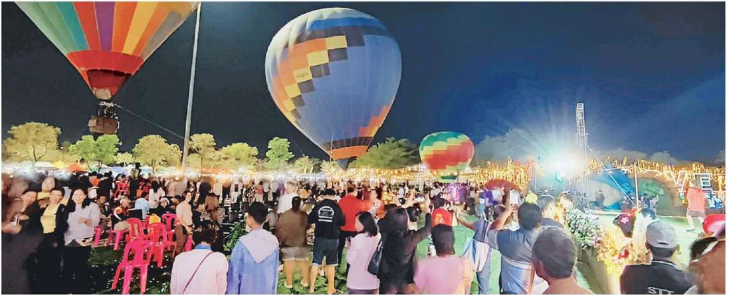
เฟสติวล พล.ต.อ.สมศักดิ์ จันทะพิงค์ นายก อบจ.นครสวรรค์ จัดงาน “บึงบอระเพ็ด คอนเทสต์ เฟสติวล 2024” เพื่อส่งเสริมการท่องเที่ยวในพื้นที่ จ.นครสวรรค์ ให้นักท่องเที่ยวได้รู้จักอย่างกว้างขวาง โดยมีกิจกรรมมากมายที่แหล่งท่องเที่ยวบึงบอระเพ็ด จ.นครสวรรค์ ปีนี้ประสบความสำเร็จคนไปร่วมงานกันมาก.