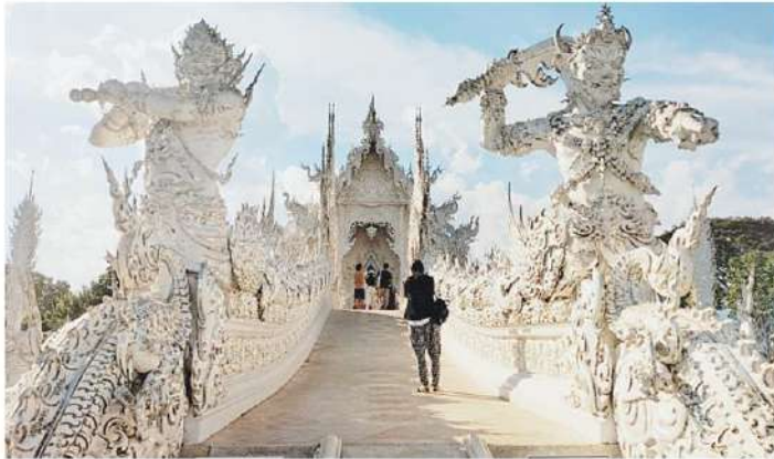
วัดสีขาว นักท่องเที่ยวให้ความสนใจเที่ยวชมความสวยงามของวัดร่องขุน หรือที่นักท่องเที่ยวต่างชาติรู้จักกันทั่วไปในนามวัดสีขาว "The White Temple" อยู่ ต.ป่าอ้อดอนชัย อ.เมือง จ.เชียงใหม่.