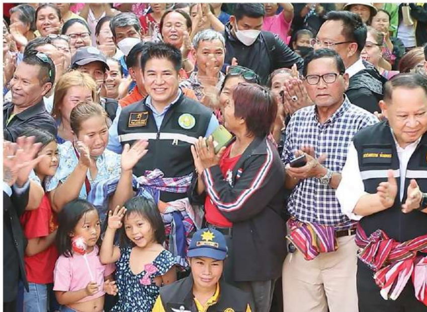
🏠 ดูแลเกษตรกร - ร.อ.ธรรมนิต พรหมเผ่า รวบรวมเกษตรกรและสหกรณ์ และคณะ เดินทางไปรับฟังปัญหาเกษตรกรสมาชิกสหกรณ์นิคมตงมุล และมอบอินดที่คืนส.ป.ก.ให้กับครอบครัวเกษตรกร ที่วัดนามูลพุทธาวาส อ.กระนวน จ.ขอนแก่น เมื่อวันที่ 3 ก.พ.