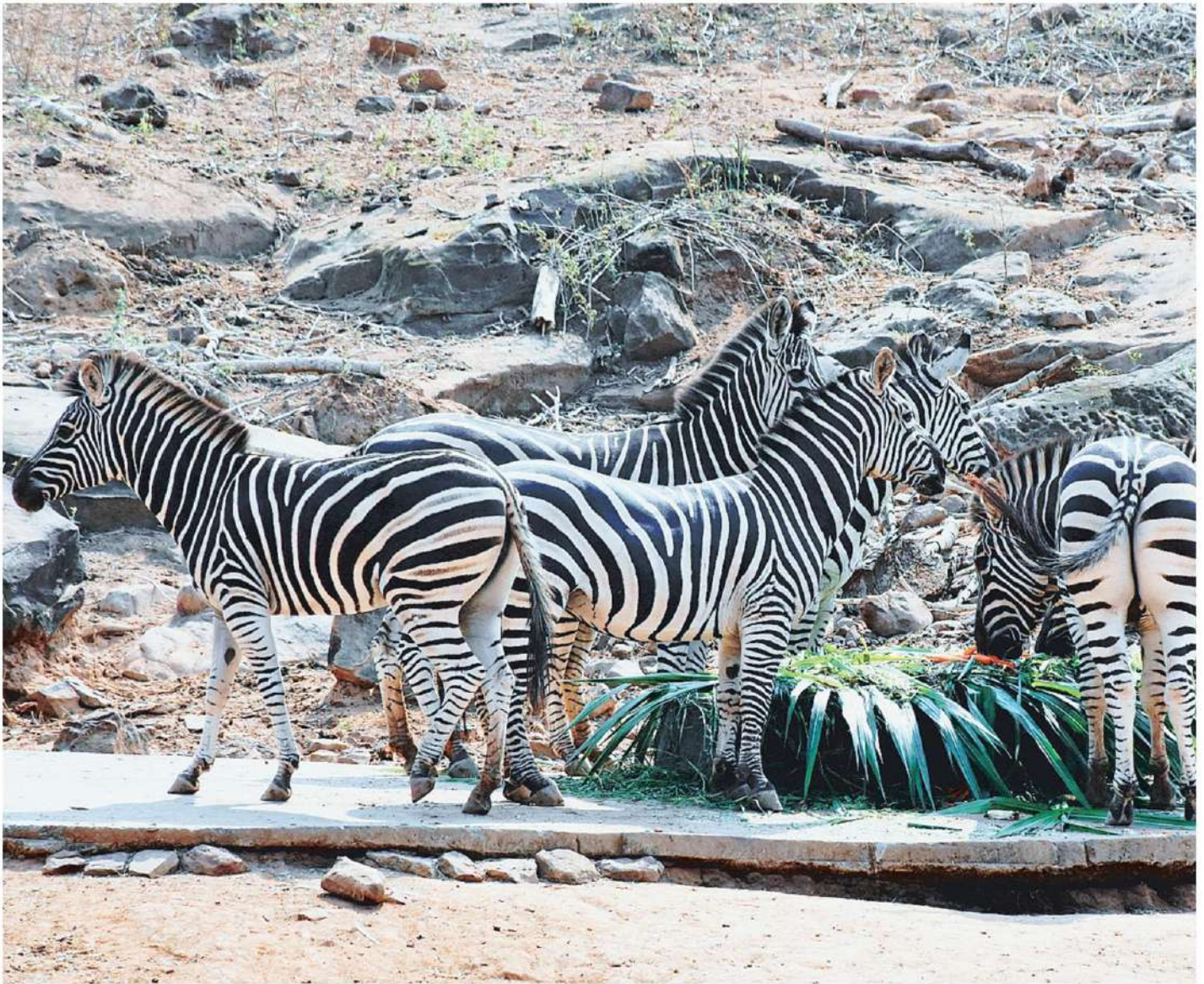
วันม้าลายสากล สวนสัตว์ขอนแก่นจัดกิจกรรมส่งเสริมท่องเที่ยวสัตว์เปิดให้คนเข้าชมม้าลายเบอร์เชลล์อย่างใกล้ชิดเป็นที่ชื่นชอบของนักท่องเที่ยวที่นิยมเที่ยวสวนสัตว์ ได้ชมสัตว์นานาชนิดหลากหลายพันธุ์ เสริมความรู้เรื่องสัตว์ และวิถีชีวิตของบรรดาสัตว์ต่างๆให้ความเพลิดเพลิน.