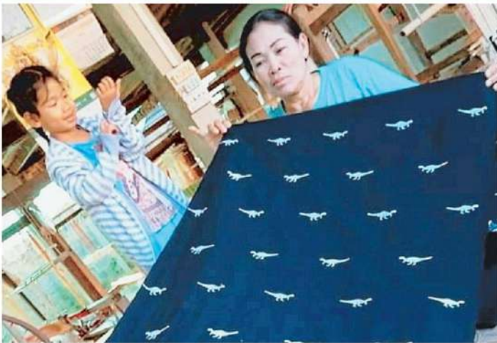
ผ้าไทยลายใหม่ จังหวัดกาฬสินธุ์วิจัยผ้าไทยลายไดโนเสาร์สายพันธุ์ใหม่ของโลก “มินิโนเกอริเซอร์ กู๋น้อยเฮนลิส” ได้สำเร็จขายระดับตู้โชว์ที่ท้าวเวร้มูลค่าสูง.