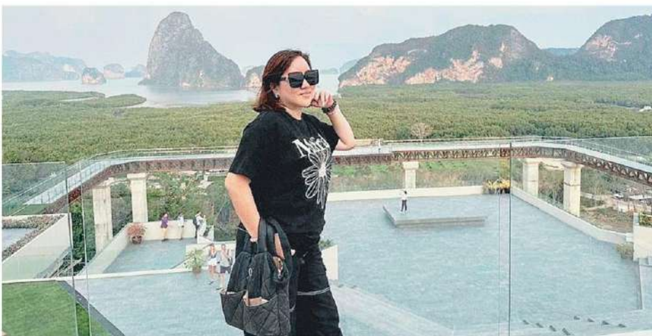
ห้ามพลาด "สกายวอล์ก เสม็ดนางชี" จ.พังงา จุดเช็คอินใหม่ที่มองเห็นวิวสวยๆ ตั้งอยู่ที่ รร.บียอนด์ สกายวอล์ก นางชี โรงแรมเคารีอะทะเลกรุป เกาะแก่งอ่าวพังงา ทะเลอันดามัน สวยงามชัดเจน.