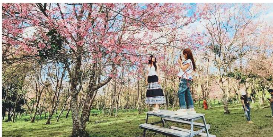
ชมพูสะพรั่ง บรรยากาศที่อุทยานแห่งชาติภูหินร่องกล้า ต.กกสะทอน อ.ด่านซ้าย จ.เลย ช่วงนี้สุดลึกลับเมื่อดอกนางพญาเสือโคร่งบานทั่วภูมโลสร้างประทับใจให้นักท่องเที่ยวเป็นอย่างมาก.