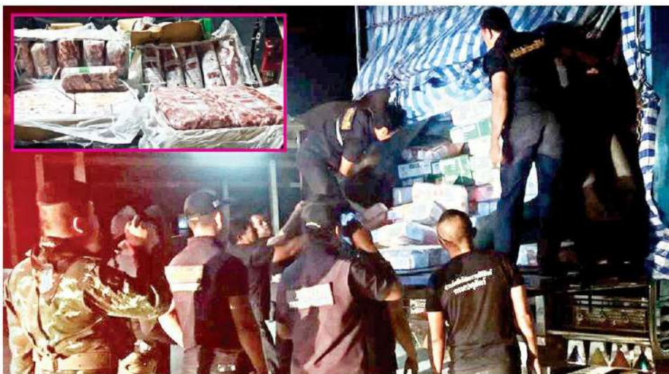
▲ เนื้อเถื่อน...จนท.ด่านกักกันสัตว์ประจวบคีรีขันธ์ กรมปศุสัตว์ ตร.สภ.ห้วยยาง และหน่วยงานเกี่ยวข้องสกัดจับการขนย้ายเนื้อเถื่อน (ภาพเล็ก) ที่ด่านตรวจความมั่นคง หมู่ 1 ต.ห้วยยาง อ.ทับสะแก จ.ประจวบคีรีขันธ์

การจับกุมครั้งนี้เป็นไปตามนโยบายของนายไชยา พรหมา รมช.เกษตรและสหกรณ์ ที่กำกับดูแลกรมปศุสัตว์ได้สั่งการให้ตรวจสอบและปราบปรามการขนสินค้าเถื่อนโดยเฉพาะเนื้อสัตว์เข้ามาในประเทศไทย จึงประสานไปยัง กอ.รมน.จังหวัดประจวบคีรีขันธ์ ให้มีการตรวจสอบกระทั่งได้รับแจ้งว่าจะมีขบวนการลักลอบขนเนื้อสัตว์เถื่อนผ่านด่านกักกันสัตว์ จึงร่วมกันสืบสวนหาจำวนทราบแน่ชัดว่า