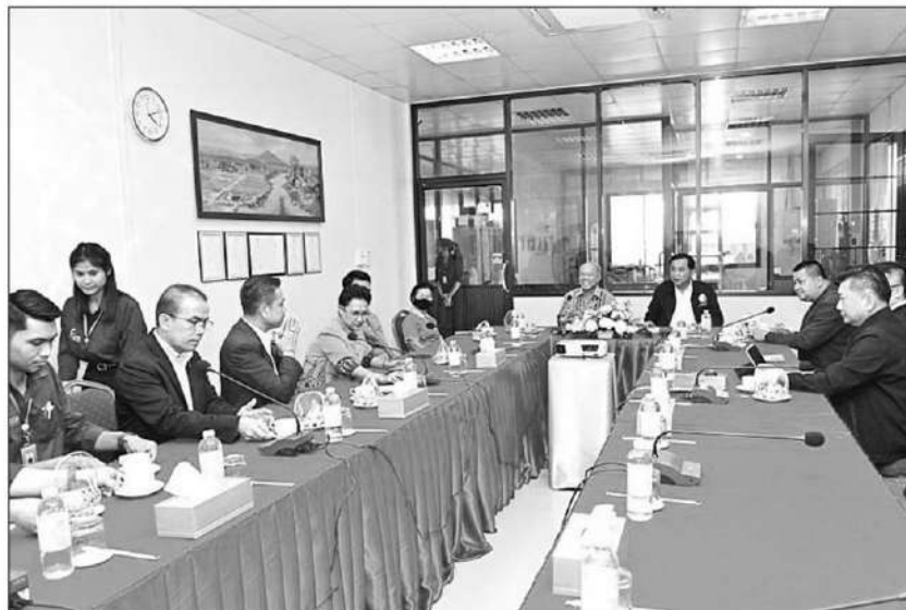
ร่วมมือ : นายอนุชา นาคาศัย รมช.เกษตรและสหกรณ์ ร่วมมือบริษัท รวมใจพัฒนาความรู้ จำกัด มุ่งเน้นผลิตเมล็ดพันธุ์ข้าวคุณภาพดี ภายหลังตรวจเยี่ยมสถานีวิจัยพันธุ์ข้าว และลงพื้นที่ อ.คลองหลวง จ.ปทุมธานี ยกกระดับผลผลิตให้แข่งขันกับประเทศเพื่อนบ้านได้ ครอบคลุมความต้องการของตลาด

“ข้าวเป็นพืชเศรษฐกิจหลักของประเทศไทย จึงเดินทางขับเคลื่อนพัฒนาข้าวไทยให้มีความก้าวหน้า ส่งเสริมเกษตรกรเพาะปลูก เน้นการพัฒนาลาดทั้งในและต่างประเทศ การแปรรูป และการนำนวัตกรรมมาใช้ให้เกิดประโยชน์เพิ่มขีดความสามารถในการแข่งขันของข้าวไทยให้มากขึ้น โดยให้กรมการข้าวหารือร่วมกับภาคเอกชน วิจัยพัฒนาปรับปรุงสายพันธุ์ข้าว ใช้สถานทดลองข้าวที่มีอยู่ทั่วประเทศ ร่วมกันไของค์ความรู้ที่มี ศึกษาทดลองเพื่อพัฒนาสิ่งใหม่ๆ ให้เกิดประโยชน์กับประเทศและชาวนาไทย” นายอนุชา กล่าว