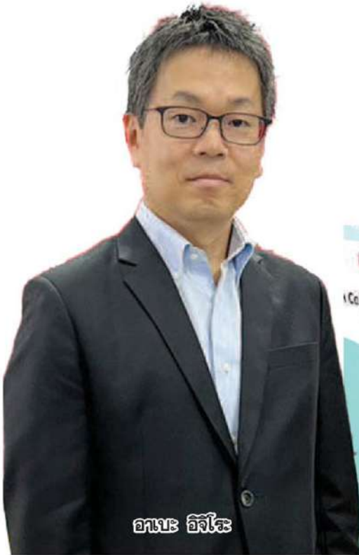
อาเบะ อิจิโร

สินค้าญี่ปุ่น โดยเฉพาะอาหารนั้นมีความคุณภาพ และยังมีอาหารอีกมากมาย ที่อยากให้ลอง อยากให้คนไทยทุกคนได้สัมผัสอาหารพรีเมียม ที่มีคุณภาพและอร่อยแบบญี่ปุ่นแท้ๆ